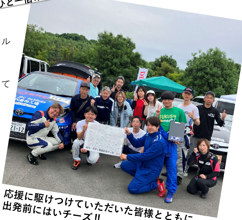
応援に駆けつけていただいた皆様とともに 出発前にはいチーズ!!