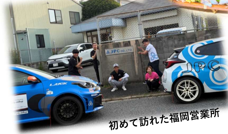
初めて訪れた福岡営業所