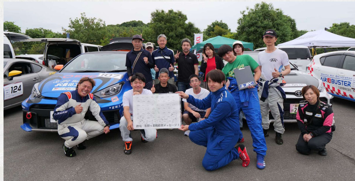
↑今回は豊田、宮崎合同での参戦となり、 たくさんの方が参戦、応援に駆けつけてくれました！

今回、宮崎ラリーサークルとして初出場となり、とても緊張しました。特に地区戦併催のため、コーナーの数が多く、距離も長かったこともあり、ドライバー、コドライバー双方とも大変なラリーでしたが、事故なく完走できました！次のラリーに向けてより速く、安全に走れるよう、練習を続けます！！そして、ラリーの楽しさ、雰囲気宮崎のメンバーに伝えることができたと思います！豊田、宮崎のラリーサークルメンバー、宮崎からの応援メンバー、そして応援コメントを送っていただいた皆様、 本当にありがとうございました！！