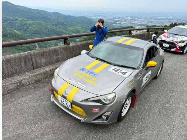
↑ SS2の待機列にて 本戦は初めての河野ドライバー 緊張が伝わってきます

昨年とは異なり曇天に恵まれ？良い路面状態の中、難易度の高いコースを駆け抜けました！