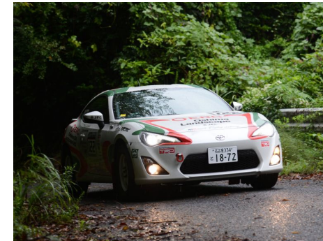
ドライバー : 大島 健資 コドライバー : 鈴木 裕一郎 車両 : 86 ERC五号車 結果 : C-3 クラス 10位