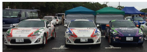
レキを終えスタートを待つ ERCメンバーの3台の86