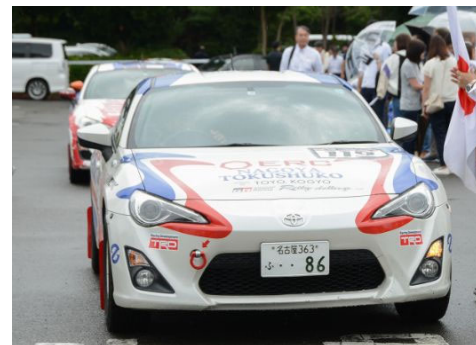
ドライバー : 鷺野 敦司 コドライバー : 内田 恭平 車両 : 86 ERC零号車 結果 : C-3 クラス 11位