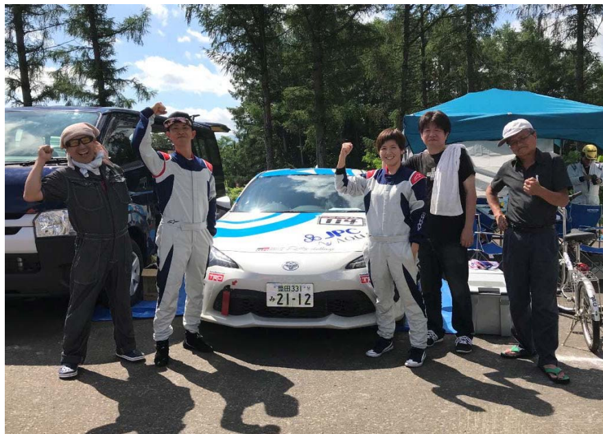
デビューした1号車と一緒に記念撮影

2018年 TGRラリーチャレンジ 第5戦に1号車で参戦 1号車のデビュー戦、100%グラベルのコースでリタイヤや SSキャンセルが発生する中、見事に完走。 青森までの長旅の疲れを癒してくれた。